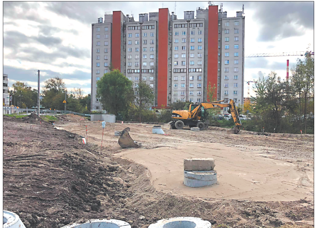
Rozbudowa skrzyżowania Centralna/Sołtysowska. Termin zakończenia – I kwartał 2022 r.

Od 5 listopada Ogród Doświadczeń im. St. Lema rozświetli wystawa „Królewna Śnieżka – Ogród Światel”. Na widzów w parku będzie czekać niemal 30 instalacji świetlnych oraz atrakcje multimedialne w tematyce jednej z baśni Braci Grimm. Wystawę możecie Państwo odwiedzać aż do 27 lutego 2022 roku. Cennik i dodatkowe informacje na stronie https://krolewnasniezka.ogrodswiatel.pl/cennik/